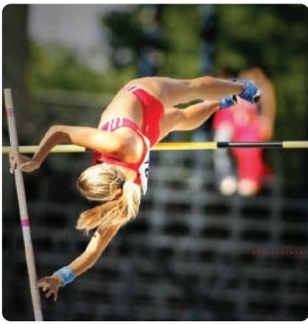
• salt de perxa