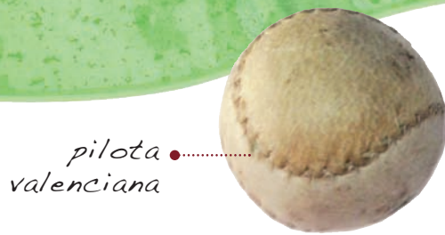
• pilota valenciana