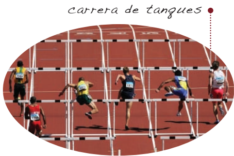
• carrera de tanques