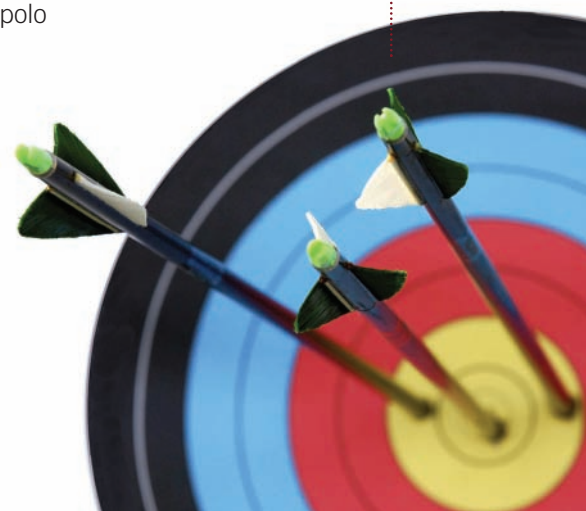
• tir al blanc