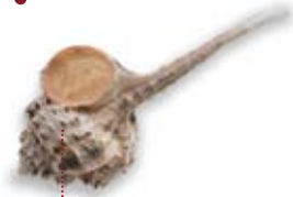
• caragol punxós