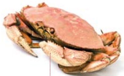
• bou de mar