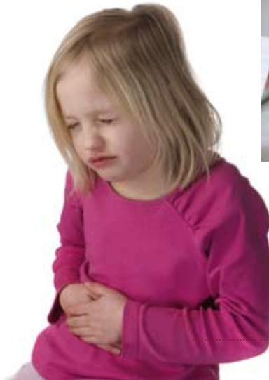
• mal de ventre