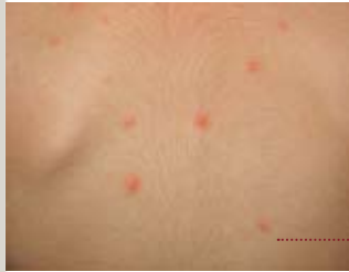
• miopia • varicel·la