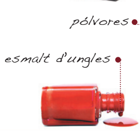
• esmalt d'ungles