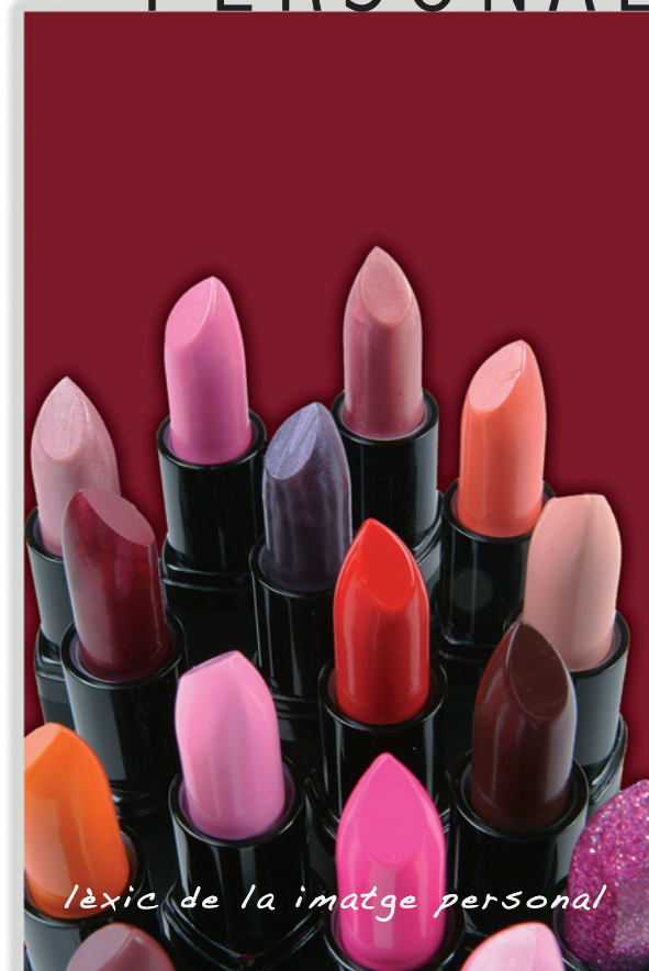
lèxic de la imatge personal