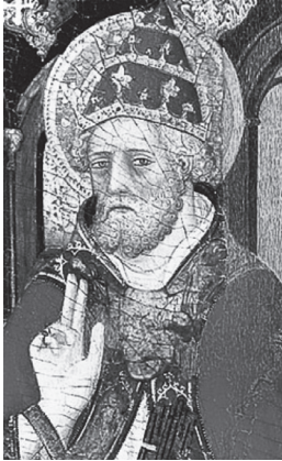
Benet XIII (1394-1423)