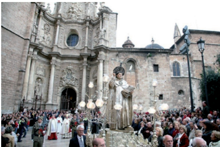
Processó general de Sant Vicent Ferrer