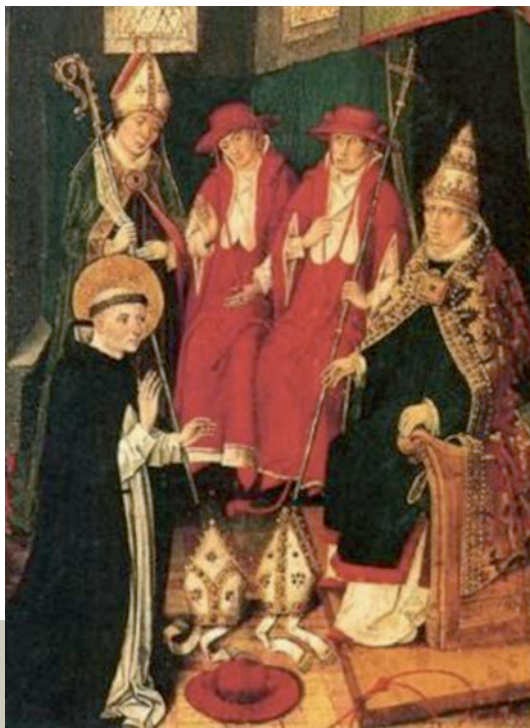
Renúncies de Vicent Ferrer

1399. El 22 de novembre Benet XIII investix Vicent Ferrer com a legat a latere Christi , amb autoritat doctrinal i penitencial, llibertat de moviments i independència de la jerarquia eclesiàstica i local. L'any 1399 abandona el palau papal i se centra en una intensa i apassionada activitat missionera i pastoral.