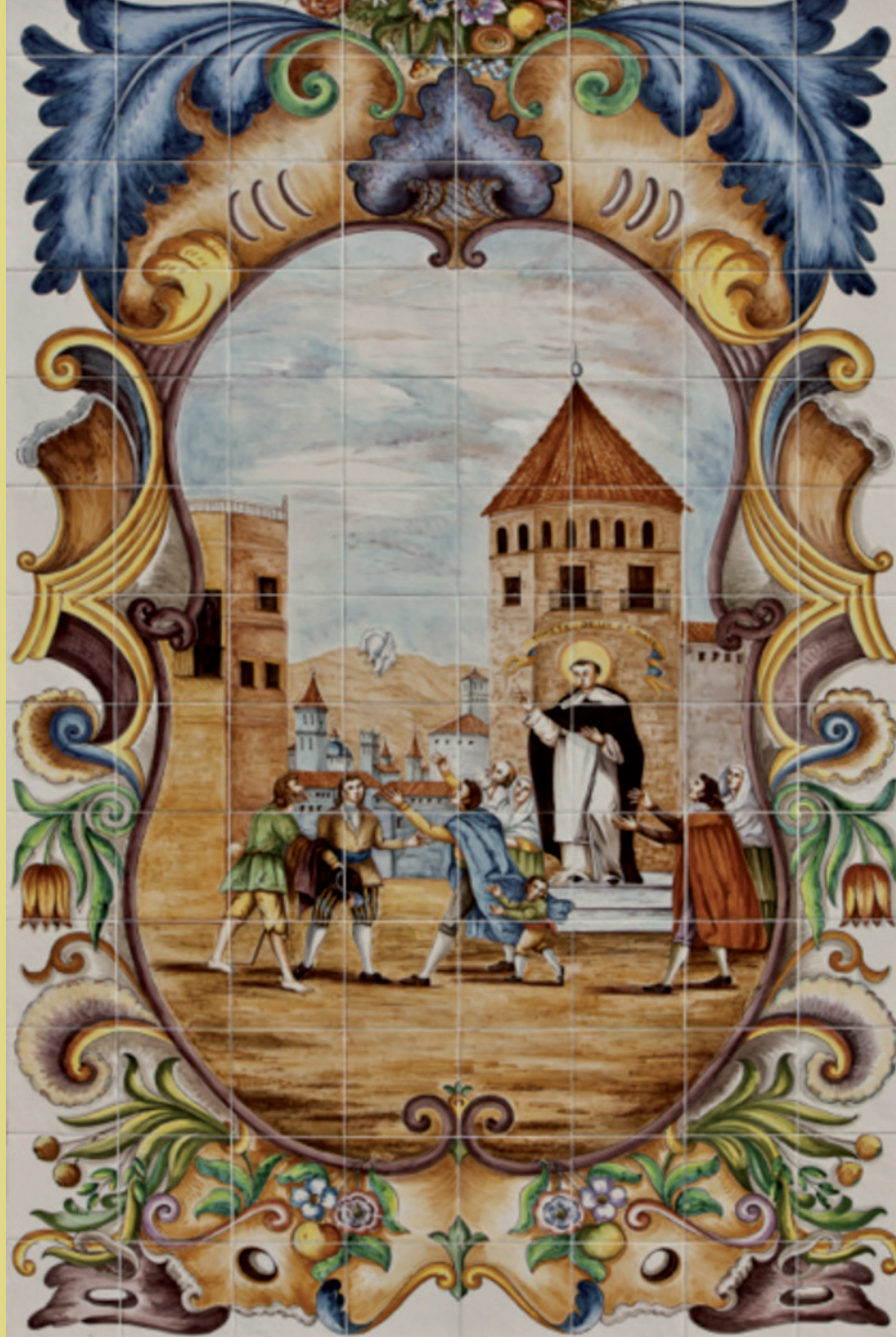
Mosaic que representa el miracle del mocadoret