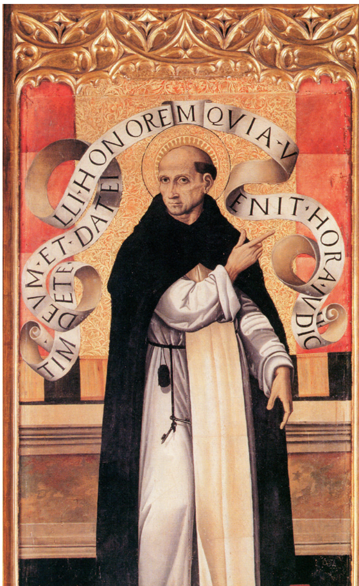
Taula central del retaule de Sant Vicent Ferrer de Miquel del Prado. Museu de Belles Arts de València