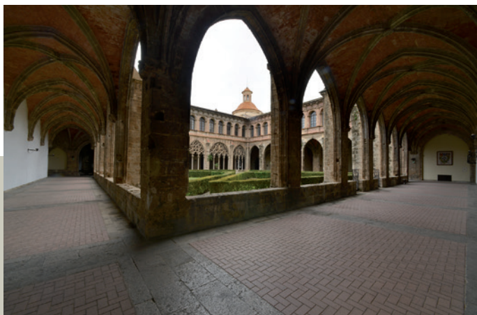
Convent de Sant Doménec. València

1379. Vicent Ferrer, prior. Va ser elegit prior del convent de Sant Doménec i intervingué com a pacificador dels enfrontaments entre els bàndols dels Vilaragut i els Centelles: «Vosaltres si voleu rebre lo Sant Esperit, que hajau concòrdia uns ab altres, lexant males costums, vicis i rancors a son proïsme».