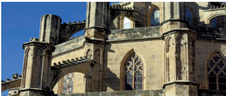
Catedral de Tortosa

En el pelegrinatge, a més de les predicacions generals, foren rellevants les trobades amb representants d'altres religions, com la predicació a Granada cridat pel rei musulmà Mohammed (1407), la predicació en la sinagoga de Salamanca (1412) i la Disputa de Tortosa entre teòlegs cristians i rabins jueus (1413-1414), convocada per Benet XIII, amb l'objectiu de forçar les autoritats religioses jueves a reconèixer els seus errors. Vicent Ferrer va acudir el gener del 1414, quan ja es realitzaven les sessions a Sant Mateu. Va escriure notes per al debat final, que, amb la participació d'altres teòlegs, esdevingueren un Tractat contra els jueus , en base al qual s'intensificaren actuacions, a vegades violentes, contra esta minoria religiosa.