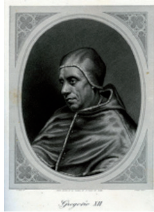
Gregori XII (1406-1415)