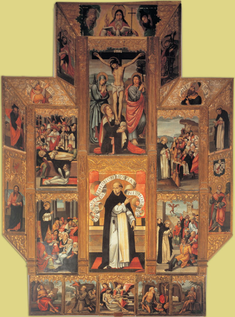
Retable de Sant Vicent Ferrer, de Miquel del Prado (primera mitat del segle XVI). Museu de Belles Arts de València