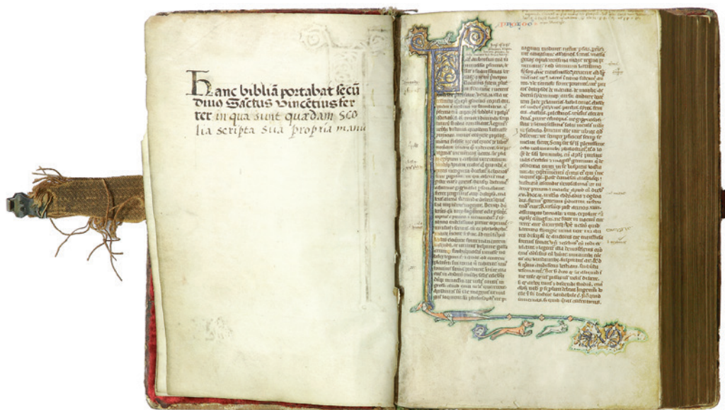
Bíblia de Vicent Ferrer. Arxiu Capitular de València

Exposicions ordenades. «Els diversos punts en què havia estat dividit el tema eren desenvolupats separadament i ordenada, sempre amb una deducció lògica, sòlida i rigorosa, i amb la corroboració d' autoritats o cites escripturístiques escaients, però això sí, tota aquella argumentació tan densament estructurada era embolcallada amb profusió de semblances o exemplis ; l'eficàcia d'aquests en la predicació era ben coneguda pels moralistes medievals: "Exempla plus movent quam predicatio subtilis".» [Manuel Sanchis Guarner]