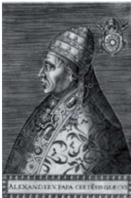
Alexandre V (1409-1410)