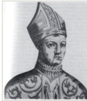
Joan XXIII (1410-1415)