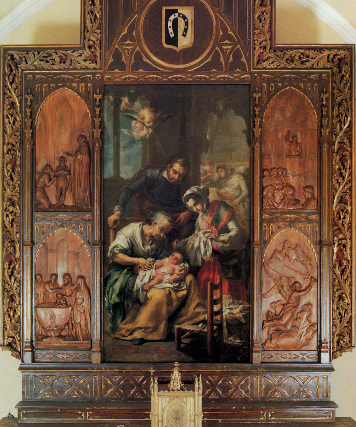
Retaule amb escenes de la vida de sant Vicent Ferrer. El llenç central, obra de Vicent López (1808), representa el naixement del sant. València, casa natal de sant Vicent Ferrer