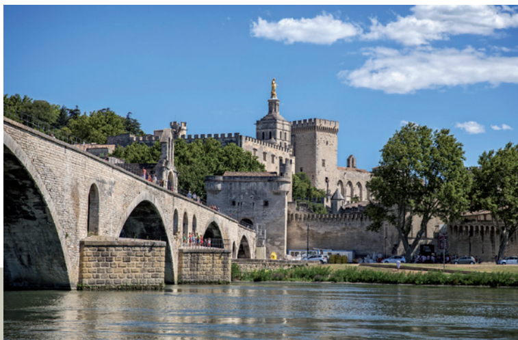
Palau Papal d'Avinyó

1394-1398. Pero de Luna, papa. El 28 de setembre, després de la mort de Climent VII, va ser elegit papa Pero de Luna, amb el nom de Benet XIII. El nou papa va cridar Vicent Ferrer a la cúria papal d'Avinyó, i el va nomenar capellà i confessor seu, teòleg i penitenciarí apostòlic. Li van oferir el bisbat de Lleida i el de València, però no els va acceptar (1396). També rebutjà ser nomenat cardenal. En este període redacta el seu Tractat de la vida espiritual .